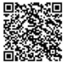
YouTube 山口博物館公式 「映像で見る防長の街道」

江戸時代の絵図と現在の動画で各街道の様子が紹介されています。7つの街道を映像で見ることができます。動画は、YouTube山口博物館公式「映像で見る防長の街道」でも配信しています。