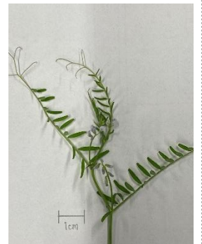
C スズメノエンドウ