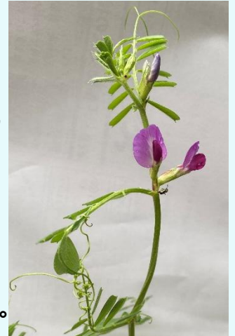
カラスノエンドウ 4/10 山博にて