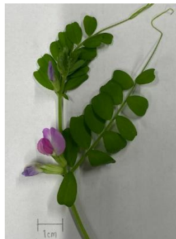
A カラスノエンドウ

カラスノエンドウより小さなお仲間は・・・「スズメ」ノエンドウ!! 確かに「スズメ」は「カラス」より ちい 小さいな。真ん中の写真の植物は、 「カスマグサ」! どうしてこの名前なのか、分かるかな? “㊦カラスと㊧スズメの間 (㊨)” だからなんですって! おもしろい!