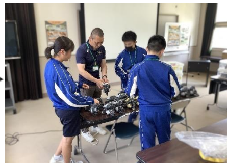
本年度の職場体験の様子