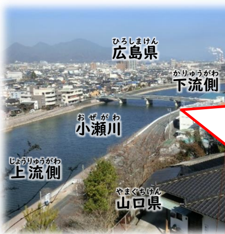
やまぐちけん 山口県