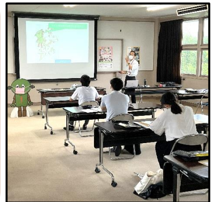
はくぶつかん かつどう 「博物館のさまざまな活動について」