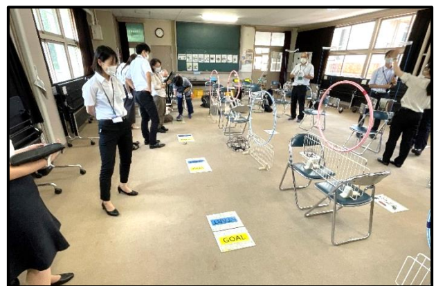
はくぶつかん きょうしつ たいけん 「ドローンプログラミング教室」体験