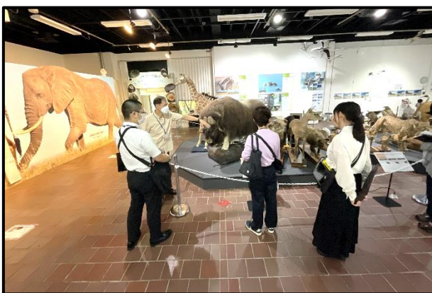
とくべつてん だいどうぶつてん けんがく 特別展「ふしぎ!おどろき!大動物展」見学