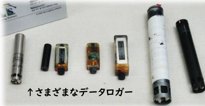
↑さまざまなデータロガー