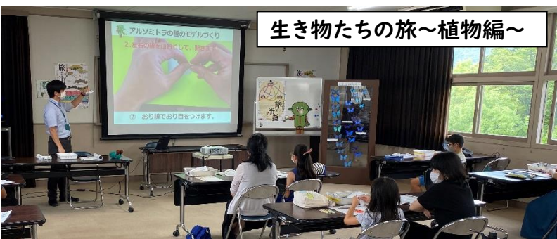
生き物たちの旅～植物編～