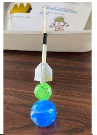
ストローロケット

参加した子どもたちは、とても熱心で、丁寧に作業に取り組み、自分なりに工夫しながらストローロケットや種子のモデルを飛ばしていました。驚きの表情や喜びの笑顔が印象的でした。夏休みの自由研究に積極的に取り組もうとする子どもたちの素敵な姿が見られた2日間となりました。今年度もたくさんの御応募をいただきありがとうございました。