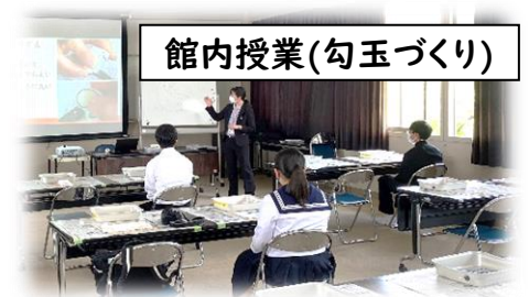
館内授業(勾玉づくり)