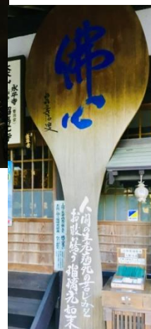
(右)県下 一おきな しゃもじ 持ち手の部分に文字が書かれています。

瑠璃光寺 五重塔 …室町時代の 山口 を中心とする 大内文化 の 代表的 建造物。博物館にも 模型 があるよ