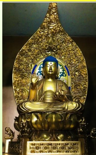
(左)瑠璃光寺本尊 薬師如来 像 ふだんは本堂の奥にみえます。今回特別に許可を得て撮影しました。