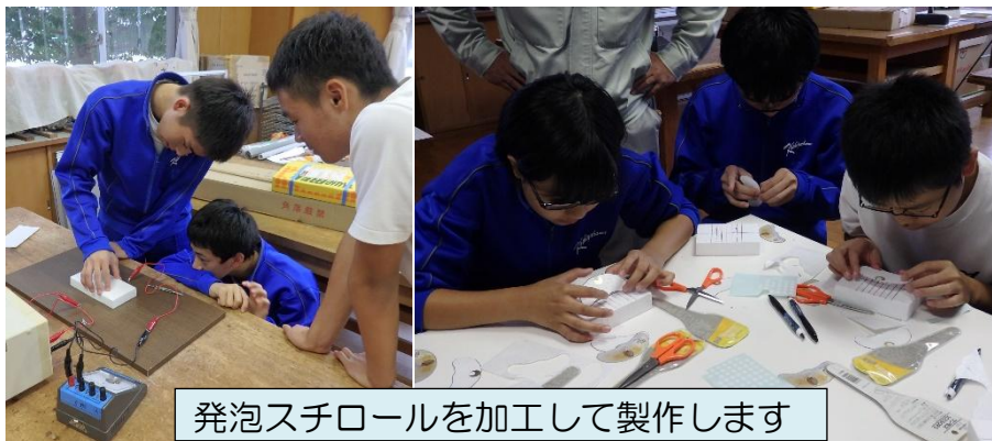
発泡スチロールを加工して製作します

先日、中学校に出前授業でお伺いしました。依頼内容は、「文化祭で、アルソミトラの種子型グライダーについての発表をしたり、他の生徒が作ることができるように指導をしたい。ノウハウを教えてください。」というものでした。