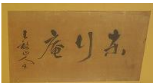
扁額「東行庵」 伊藤博文 書