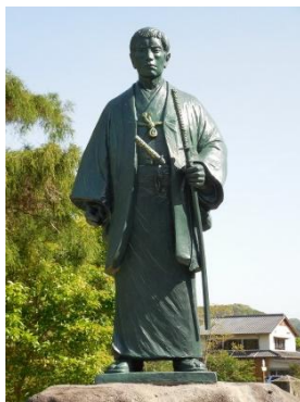
高杉晋作銅像 (東行庵)