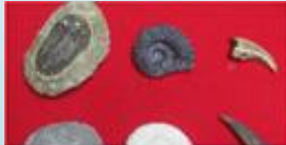
化石標本(手触り可能)