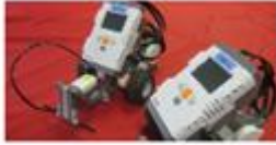
レゴマインドストーム