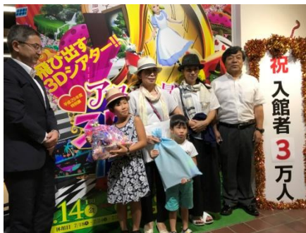
入館者3万人セレモニー

7月14日(金)から開催しておりました特別展『アリスと大冒険「3Dふしぎ博物館」』は、8月27日(日)をもちまして閉幕となりました。シアター、展示、講座、工作などをおして、多くの「3Dのふしぎ」を体感いただきました。