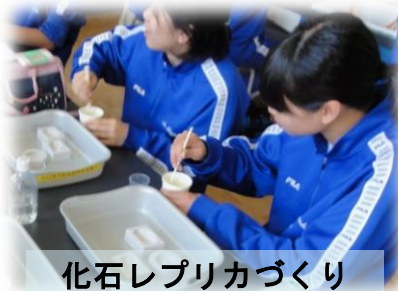
化石レプリカづくり