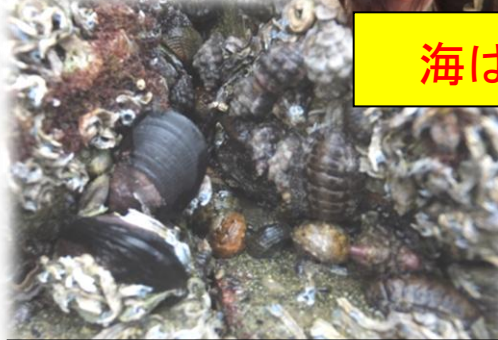
消波ブロックでは磯の生き物も！

5月25日（日）に、周南市の櫛ヶ浜の海岸で出前授業「干潟の生物を観察する会」が行われました。多数の参加者と干潟に入り多様な生物の調査を行いました。子どもたちは次々に生き物を見つけて歓声を上げていました。このような自然に対する気持ちを大切にしてほしいものです。