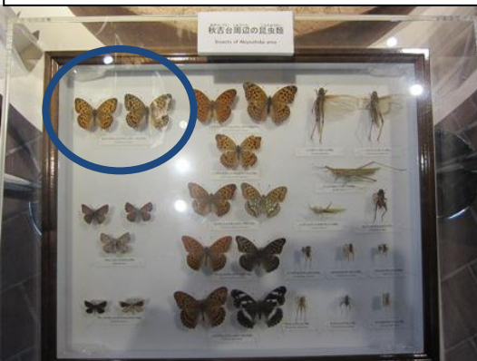
左上がオオウラギンヒョウモン