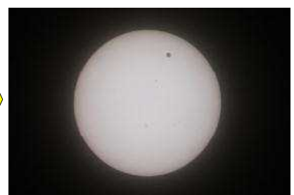
（12時ごろ） （県立山口博物館にて撮影）