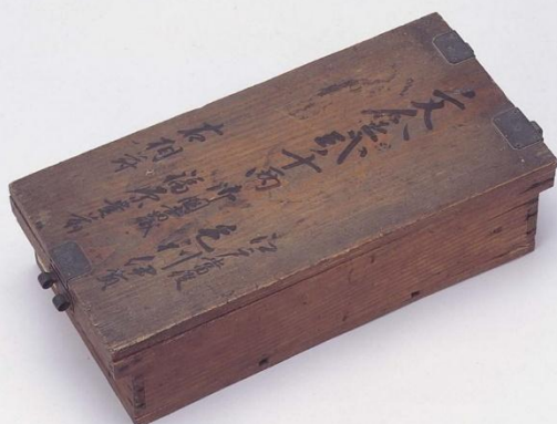
ぶんきんにせんりょうばこ 文金貳千両箱