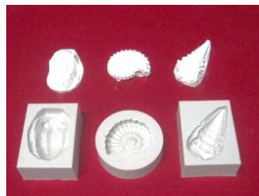
化石レプリカ用雌型