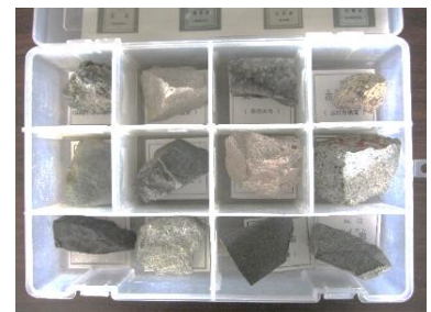
山口県の岩石標本